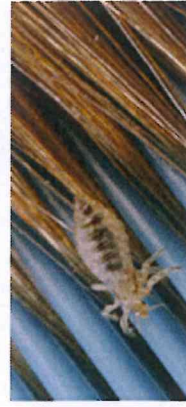
Hoofdluis op een kam.